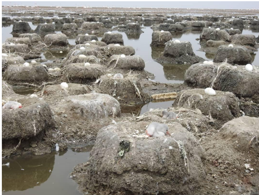
شکل ۶: لانه‌های فلامینگو بزرگ در محل جوجه‌آوری. تالاب شادگان.

نتایج نشان داد بیشترین تعداد و درصد تخم‌گذاری در بازه زمانی در ۱۶ تا ۲۰ اسفند صورت گرفته است (شکل ۷). شروع زمان تخم‌گذاری در ۱۰ اسفند و خاتمه آن در ۱۰ فروردین است. تخم فلامینگو بزرگ بیضی شکل و نسبتاً کشیده و متقارن، دارای پوشش گچی سفید رنگ است. تخم‌گذاری جمعیت جوجه‌آور فلامینگو در مدت زمان تقریباً طولانی (حدود ۳۰ روز) انجام می‌شود. به طوری که در یک محل جوجه‌آوری، هم‌زمان می‌توان جوجه‌هایی را که چندین روز است که ترک لانه کرده‌اند، جوجه‌هایی در مرحله لانه‌نشینی، تخم‌های در حال تفریح و همچنین تخم‌گذاری با تاخیر برخی دیگر از والدین را مشاهده نمود.