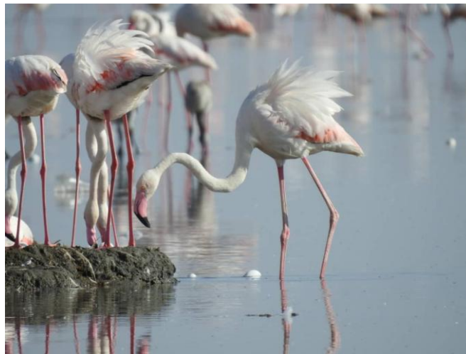
شکل ۸: فلامینگو بزرگ در محل جوجه‌آوری و تخم‌های افتاده در آب. تالاب شادگان.

دارند ولی طی بازدیدها شواهدی از حمله این گونه‌ها به کلونی به دست نیامد. شاید علت آن روش جوجه‌آوری فلامینگو باشد که آشیانه‌های آنها به‌صورت متراکم ساخته شده و وجود تعداد زیادی از پرندگانی بالغ در این مکان، راه را برای شکار آسان جوجه‌ها و از بین رفتن تخم‌ها می‌بندد. تالاب شادگان یک اکوسیستم ارزشمند و شناخته شده و عضو کنوانسیون رامسر است. منطقه جوجه‌آوری فلامینگو بزرگ هم یک بخش مهم از این بدنه آبی است. بنابراین اگرچه لازم است در طول سال این منطقه از هر آلودگی و تخریبی به دور باشد و در دوره زادآوری فعالیت‌های حفاظتی و مراقبتی افزایش یابند ولی باید در نظر داشت بدون داشتن نگاه اکوسیستمی و دیدن همه بخش‌های تالاب، حفاظت از این منطقه به‌عنوان یک بخش مستقل نتیجه‌بخش نخواهد بود و لازم است حفاظت از کل تالاب مد نظر قرار گیرد تا این منطقه کلیدی بابت عدم رسیدگی به دیگر بخش‌های تالاب آسیب نبیند.