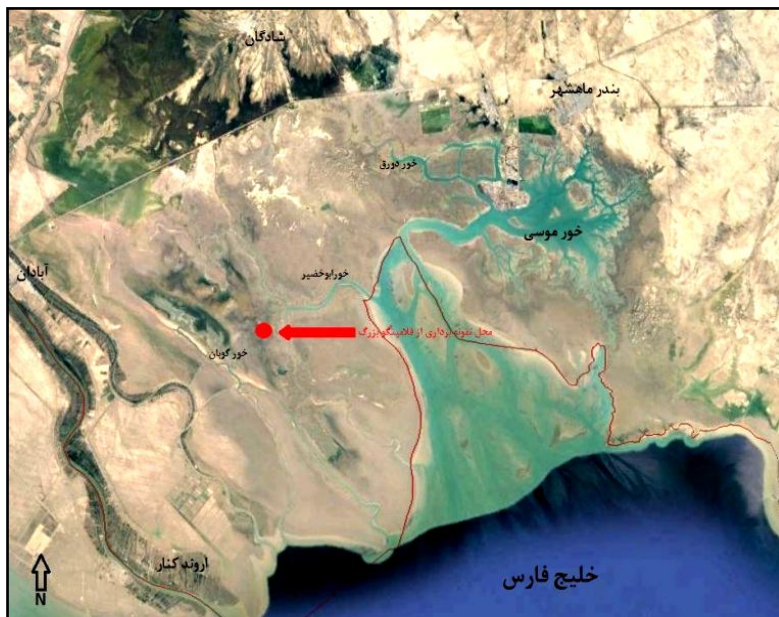
تصویر ۲: منطقه انتخاب شده جهت بررسی آشیانه‌ها در تالاب شادگان