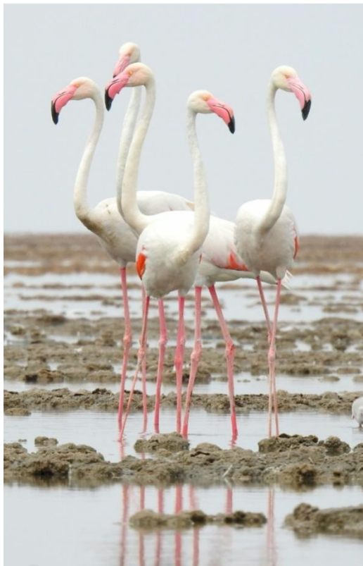
شکل ۴: فلامینگو بزرگ در زمان شروع لانه‌سازی. تالاب شادگان