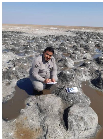
شکل ۳: ثبت داده‌های مربوط به تخم و آشیانه‌های انتخاب شده برای مطالعه

پس از شروع تخم‌گذاری و انتخاب ۶۰ آشیانه به‌طور تصادفی، ابعاد تخم به این صورت اندازه‌گیری گردید: قطر بزرگ یا طول تخم، قطر کوچک یا عرض تخم، توسط کولیس با دقت 0/02 میلی‌متر و وزن تخم با کمک ترازوی دیجیتال با دقت 0/1 گرم. پس از اندازه‌گیری ابعاد تخم، تک‌تک تخم‌ها شماره‌گذاری شده و تا پایان جوجه‌آوری تحت نظر قرار گرفتند. کنار هر لانه فلامینگو یک شاخص نصب شد. از متر پارچه‌ای برای اندازه‌گیری ابعاد آشیانه، ارتفاع و فاصله آشیانه‌ها از یکدیگر استفاده گردید. آشیانه‌های مورد تحقیق در محدوده زمانی اسفند تا اردیبهشت و هفته‌ای یک روز بررسی و داده‌های آنها ثبت می‌شد.