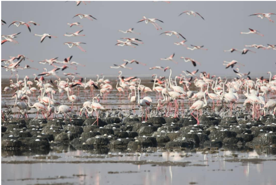
شکل ۱: کلونی فلامینگو بزرگ در محل جوجه‌آوری، تالاب شادگان، ۱۳۹۸

از تخم‌ها و جوجه‌ها شرکت می‌کنند (Johnson and Cézilly, 2009). در تالاب شادگان از اوایل اسفند آشیانه‌سازی شروع شده و در اواخر اسفند تخم‌گذاری می‌کنند. آشیانه‌سازی در دسته‌های بزرگ و در انتهای ناحیه جزر و مدی، با بالا کشیدن گل‌ولای اطراف و ایجاد توده‌ای استوانه‌ای به قطر ۴۰ سانتی‌متر، ۲۵ سانتی‌متر ارتفاع از زمین و عمق ۳ تا ۵ سانتی‌متر ایجاد می‌کنند. به‌طور معمول یک و گاهی ۲ تخم می‌گذارد و نر و ماده به نوبت روی تخم‌ها می‌خوابند. تخم‌ها در ابعاد ۵۵ \times ۹۰ میلی‌متر و وزن ابتدایی ۱۵۰ گرم هستند (الوندی، ۱۳۹۹).