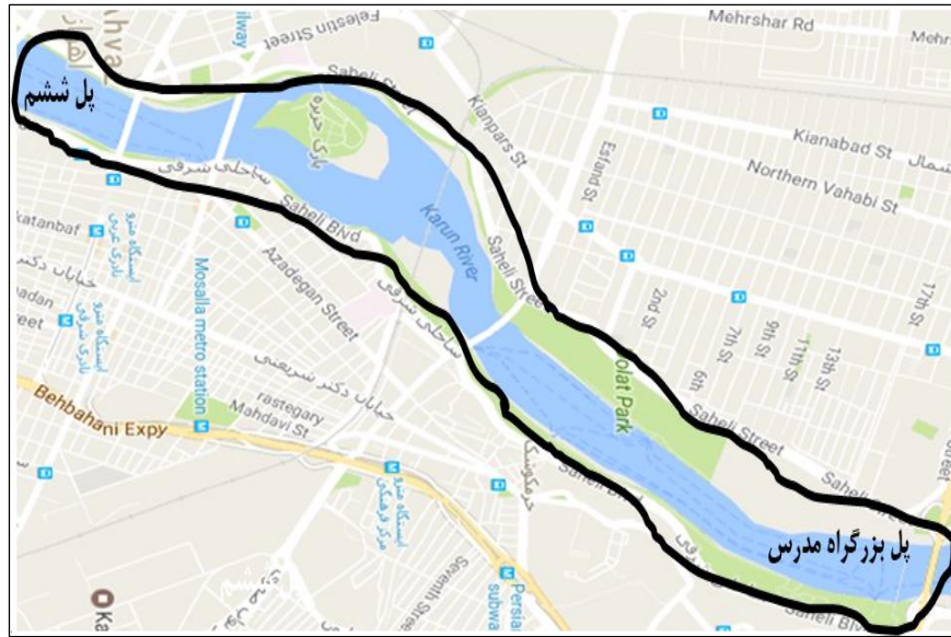
شکل ۱: محدوده بررسی پرندگان رودخانه کارون در محدوده شهر اهواز.