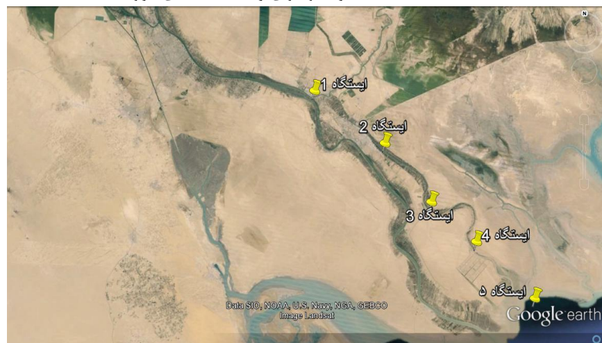
شکل ۲: عکس ماهواره‌ای موقعیت ایستگاه‌های نمونه برداری در رودخانه بهمن شیر.

برای نمونه برداری از آب، بطری نمونه بردار روتنر به عمق یک متری فرستاده شده و نمونه برداری در هر ایستگاه با ۳ تکرار انجام شد. نمونه‌های آب در بطری‌هایی که از قبل استریل شده بودند ریخته و به آزمایشگاه منتقل شدند. بطری‌ها با محلول آب مقطر و اسید نیتریک ۲ درصد (ساخت شرکت مرک آلمان) شستشو گردیدند.